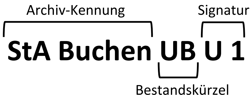
Abbildung 3: Aufbau der Archiv-Signatur des Stadtarchivs Buchen

Wie jedes andere Archiv arbeitet auch das Stadtarchiv Buchen mit einer sogenannten Archiv-Signatur. Diese dient zunächst einmal für die Verzeichnung und spiegelt dadurch auch die festgelegte innere Ordnung des Archivs wider. Ebenso können Archivbenutzer mittels der Archiv-Signatur gezielt Archivalien zur Einsicht im Stadtarchiv bestellen oder Auskünfte darüber erhalten. Darüber hinaus hat die Archiv-Signatur die Funktion der wissenschaftlichen Zitation innerhalb der Geschichtsforschung aber auch für populärwissenschaftliche Bücher und Artikel, deren Verwendung das Stadtarchiv nahelegt. Die Archiv-Signatur besteht aus drei Bausteinen, nämlich der Archiv-Kennung , dem Bestandskürzel und der eigentlichen Signatur für die einzelne Archivalie innerhalb des jeweiligen Bestandes.